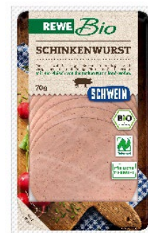
Tierwohl & Klimaschutz